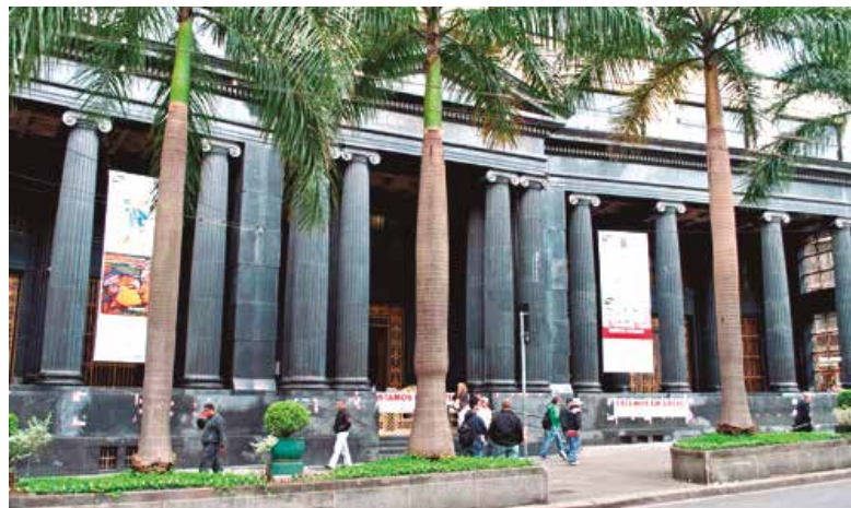
Agência Sé, centro da capital, onde ocorreram as autuações

- aterramento das instalações elétricas do prédio, inclusive chuveiros dos vestiários dos terceirizados.