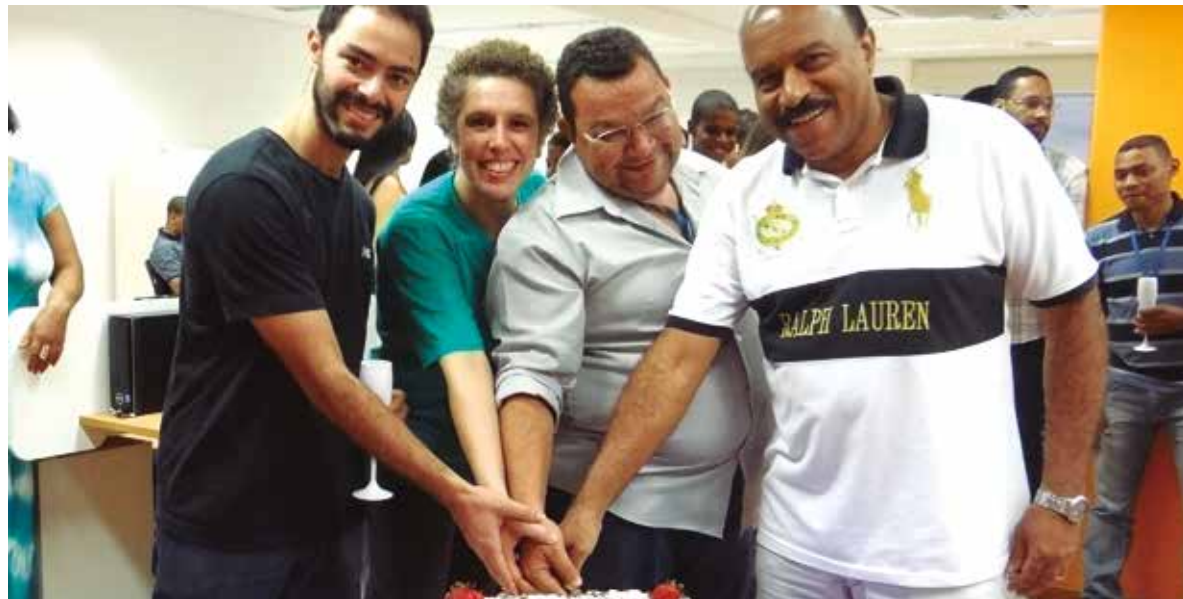
Diretores comemoram o aniversário da APCEF/SP em 2014

Tem comemoração em todo o Estado no sábado, dia 2. Faça já sua reserva!