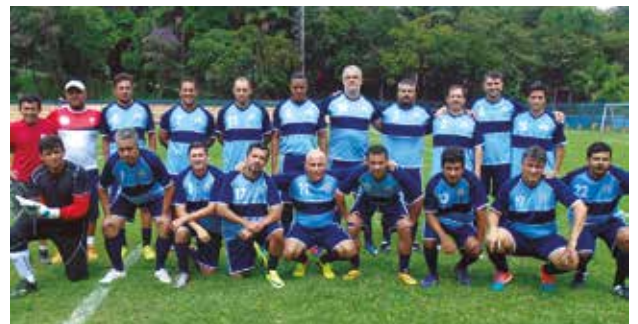
Foto acima, reunião na sede da APCEF/SP sobre o Plano de Apoio à Aposentadoria (PAA) no dia 12; no meio, primeira etapa do Torneio de Tênis no clube, dia 12, e equipe participante do amistoso de futebol de campo no dia 13, no clube. Para saber mais ou ver outras fotos, acesse www.apcefsp.org.br ou www.facebook.com/apcefsp