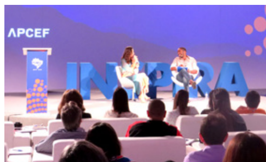
Monica Iozzi e Lázaro Ramos no Inspira Fenae 2018, no Rio de Janeiro

A exemplo das outras edições, o evento foi pensado para atender necessidades dos trabalhadores da Caixa, apontadas por meio de pesquisa aplicada no Brasil inteiro. Em sua primeira edição, o Inspira foi realizado em Brasília e, no ano passado, no Rio de Janeiro.