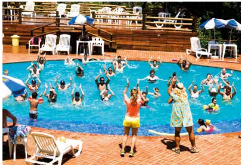
Carnaval na Colônia de Avaré

Reservas foram abertas dia 28. Suarão e Ubatuba estão com lista de espera