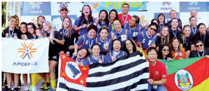
Ao centro, a equipe tricampeã de futsal da APCEF/SP durante premiação dos Jogos da Fenae

Uma das bandeiras desta gestão da APCEF/SP é o incentivo à prática esportiva, com o objetivo de integrar os empregados da Caixa e promover atividades que despertem o gosto por atitudes saudáveis.