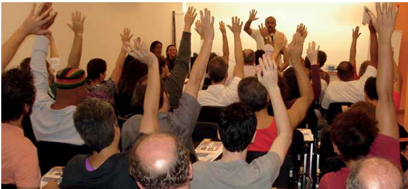
Empregados reunidos em assembleia, no dia 23, aprovam balanços da APCEF/SP

Tanto o balanço de atividades como o patrimonial foram aprovados em assembleia e pelo Conselho Deliberativo