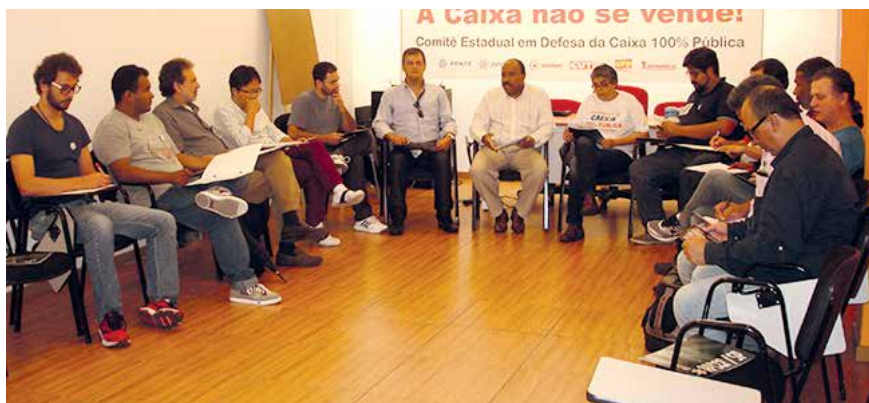
Instalação do Comitê Estadual em defesa da Caixa Econômica Federal

Declaração de Dilma Rousseff causou indignação e deflagrou campanha de toda a sociedade pela não privatização do banco