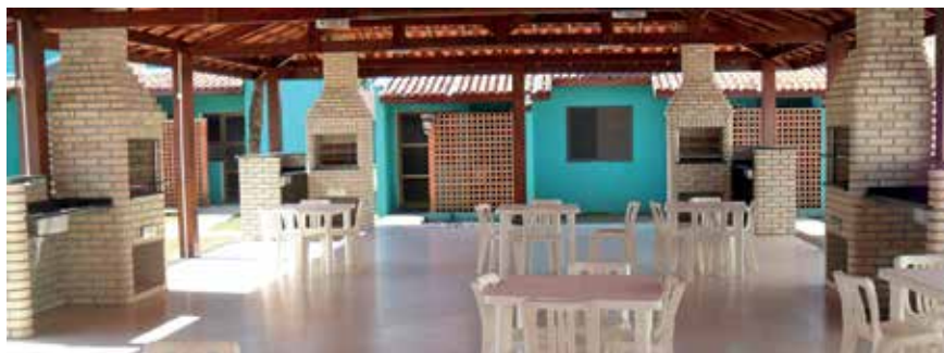
Novas churrasqueiras na Colônia de Ubatuba

Para saber mais sobre os nossos espaços, acesse www.apcefsp.org.br , ícone Sedes.