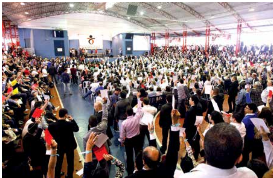
Assembleia em 2014 aprova a proposta apresentada pelos banqueiros e encerra a campanha salarial

Outras dúvidas, fale com a Associação pelo telefone (11) 3017-8315 ou pelo e-mail sindical@apcefsp.org.br .