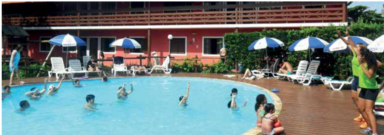
Colônia no litoral sul, na praia de Suarã, em Itanhaém