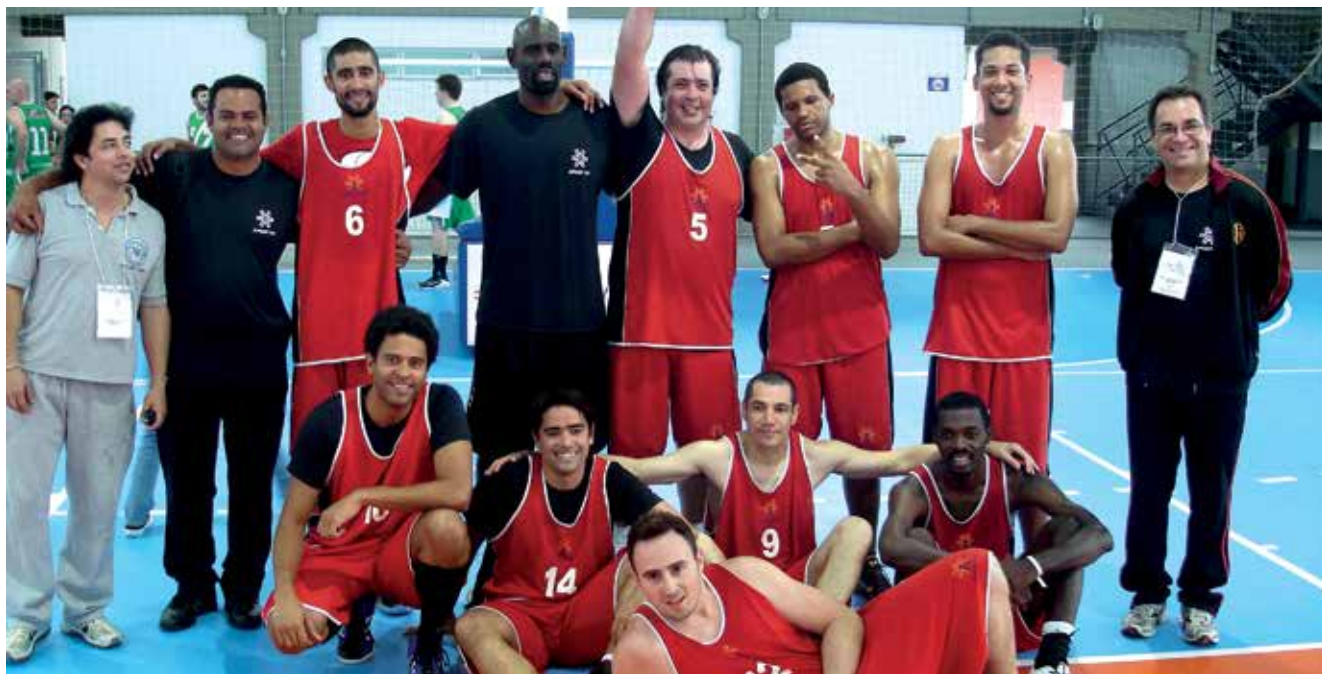
Atletas do basquete, campeões da edição de 2013 dos Jogos Sul e Sudeste, em Florianópolis

2015 é um ano especial para nosso Estado. Pela primeira vez, São Paulo será sede dos Jogos Regionais do Sul e Sudeste.