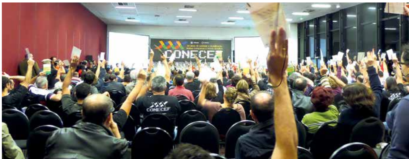
Votação durante o Congresso Nacional da Caixa em 2014

O Comando Nacional dos Bancários e a Comissão Executiva dos