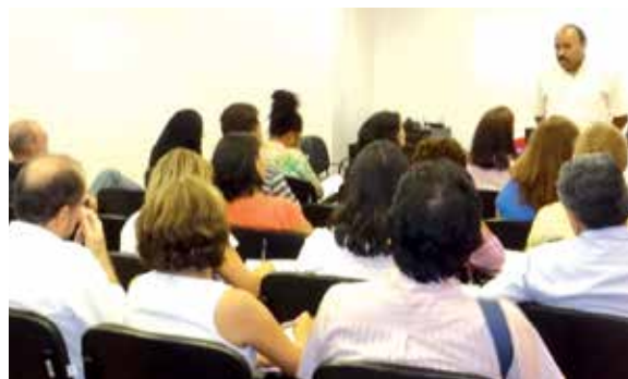
Reunião sobre o Plano de Apoio à Aposentadoria em março

liar os empregados na decisão de aderir ou não ao Plano de Apoio à Aposentadoria (PAA).