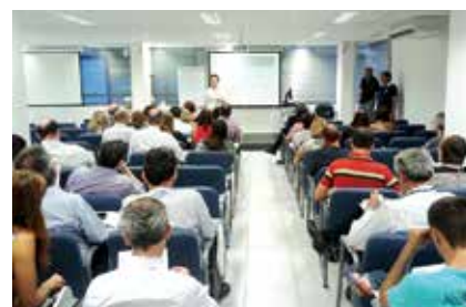
Reunião sobre a Funcef na SR Santana, em janeiro (foto maior); na SR Ipiranga e em Santos, ambas em março